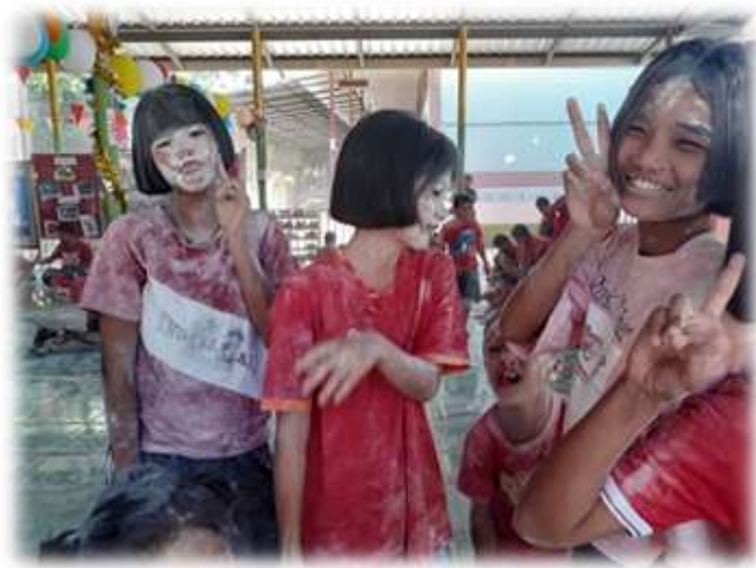
กิจกรรมส่งเสริมสถานศึกษาจัดการเรียนการสอนที่ยึดโยงกับบริบทของชุมชนท้องถิ่น